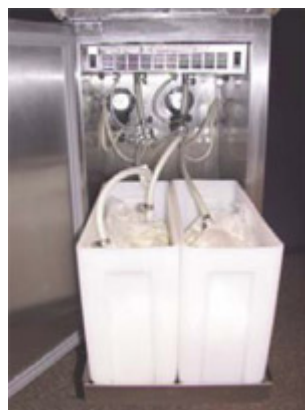
Kylutrymme med utdragbar hylla