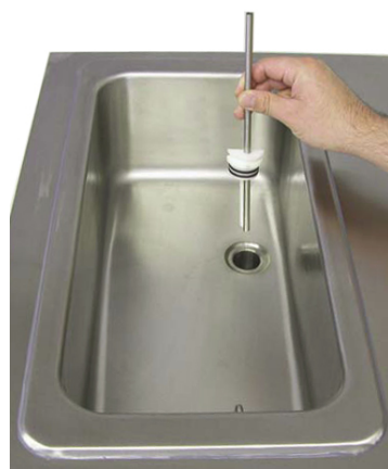
Mixbehållare med mix- & luftinblandningsrör