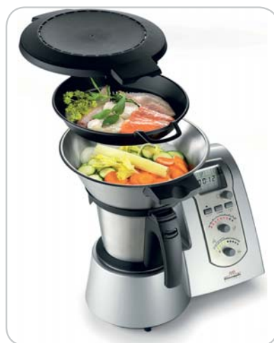
Applicazione opzionale Steamer Steamer cooking set optional